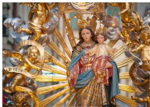
Mária, keresztények segítsége templom (Basilica Santa Maria Ausiliatrice), Róma